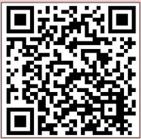
制度説明動画 QRコード (最高裁判所HP)

※ご本人の状態を踏まえて、成年後見人には家庭裁判所でご本人の行為に関する同意権・代理権が付与され、支援します。また、援助内容は家庭裁判所への報告が義務づけられています。