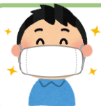
熊本市高齢者支援センターささえりあ浄行寺 職員一同